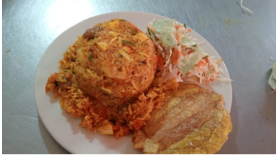
Arroz marinero Acompañado por ensalada, un tostada y sancocho de pescado $45.000