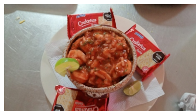
Seviche grande Acompañado por tres paquetes de galletas o tres tostadas $52.000