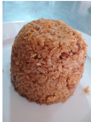
Porción de arroz con coco $6.000