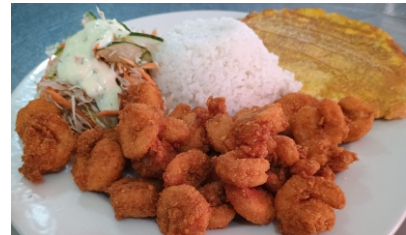
Camarón apanado Costa de arroz coco o arroz blanco, ensalada, tostada y sancocho de pescado $45.000