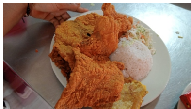
Chuleta de pescado Costa de arroz coco o arroz blanco, ensalada, tostada y sancocho de pescado $42.000