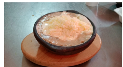
Cazuela de mariscos Viene acompañado por arroz coco o arroz blanco ensalada, tostada, queso y crema de leche $42.000