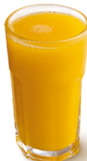
Jugo en leche $10.000