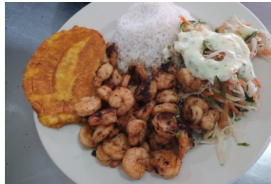
Camarón al ajillo Costa de arroz coco o arroz blanco, ensalada, tostada y sancocho de pescado $45.000