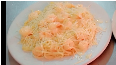
Espaguetis con camarón Viene acompañado por queso, ensalada, tostada y sancocho de pescado $45.000