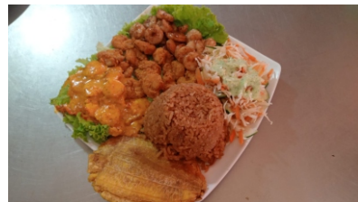
Trifásico de camarón Viene acompañado por camarón sudado, apanado, al ajillo, ensalada, tostada y sancocho $55.000