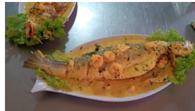
Pelada sudada costa de arroz coco o blanco, ensalada, tostada, sancocho y camarones sudados $55.000