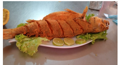
Pelada frita Costa de arroz coco o blanco, ensalada, tostada y sancocho $45.000