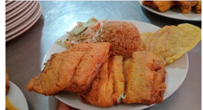
Pescado frito Costa de arroz coco o blanco, ensalada, tostada y sancocho $28.000