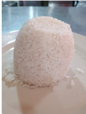
Porción de arroz blanco $5.000