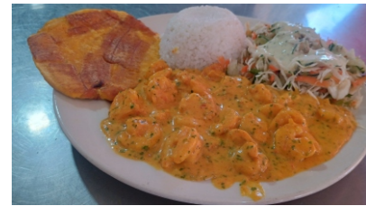
Camarón sudado Costa de arroz coco o arroz blanco, ensalada, tostada y sancocho de pescado $45.000