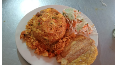
Arroz endiablado Es picante y viene acompañado por ensalada, un tostada y sancocho de pescado $45.000