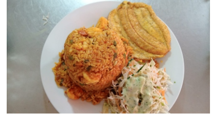
Arroz con camarones Acompañado por ensalada, un tostada y sancocho de pescado $42.000