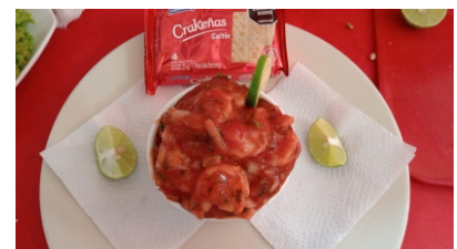
Seviche pequeño Acompañado por un paquete de galleta o una tostada $28.000