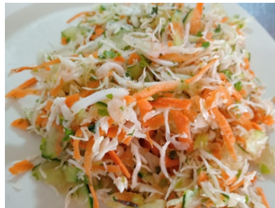
Porción de ensalada $4.000