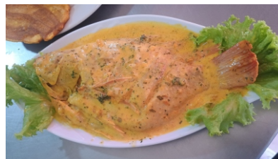
Tilapia sudada Costa de arroz coco o blanco, ensalada, tostada y sancocho $42.000