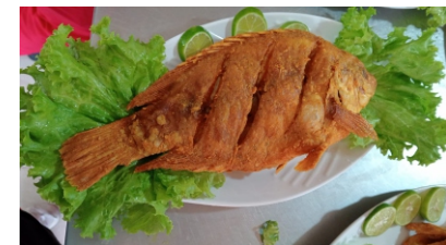
Tilapia frita Costa de arroz coco o blanco, ensalada, tostada y sancocho $42.000