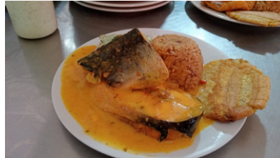
Pescado sudado Costa de arroz coco o blanco, ensalada, tostada y sancocho $28.000