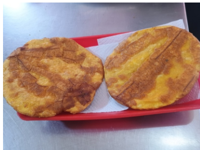
Porción de tostadas $4.000