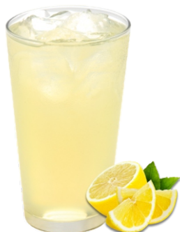
Jugo en agua $7.000