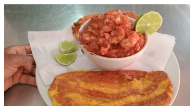
Seviche mediano Acompañado por dos paquetes de galletas o dos tostadas $42.000