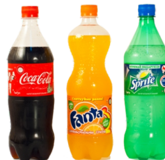
Agua, jugo, gaseosa $3.000 $4.000 $4.000